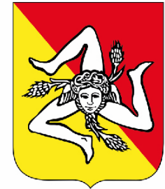
Regione Siciliana Presidenza